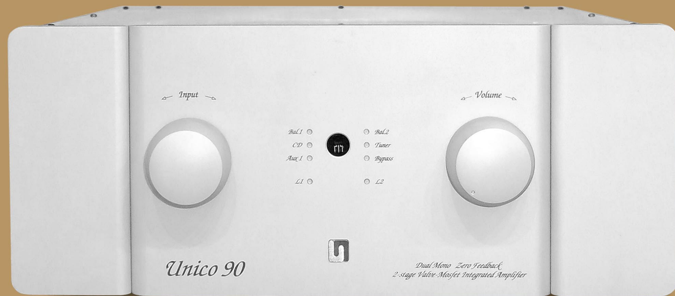
Vollverstärker Unico 90