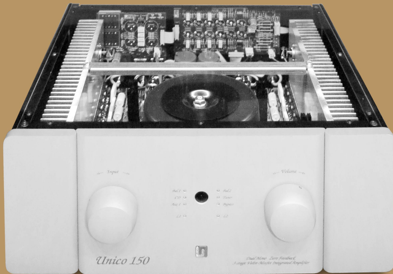
Vollverstärker Unico 150