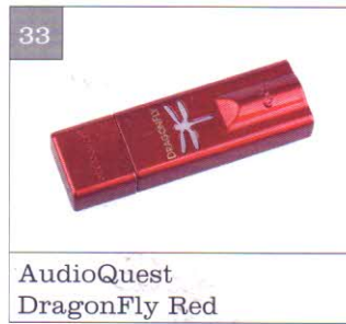
AudioQuest DragonFly Red