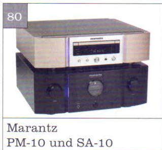
Marantz PM-10 und SA-10