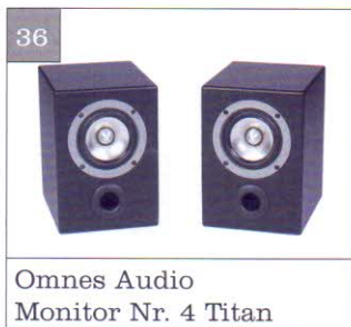
Omnes Audio Monitor Nr. 4 Titan