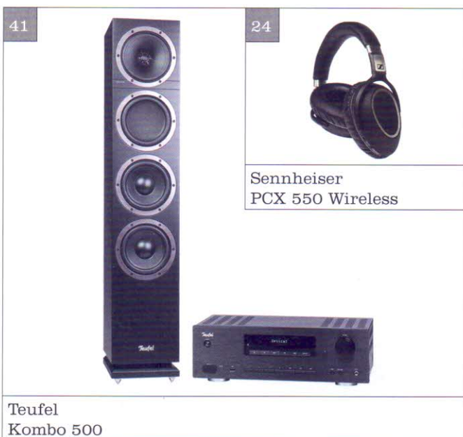
Teufel Kombo 500