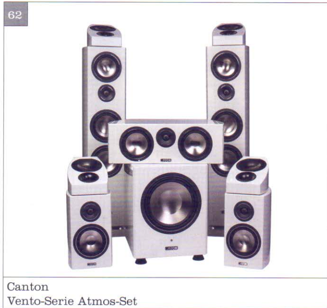
Canton Vento-Serie Atmos-Set