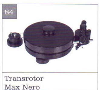
Transrotor Max Nero