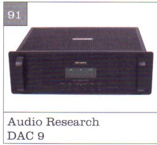
Audio Research DAC 9