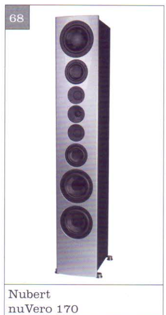
Nubert nuVero 170