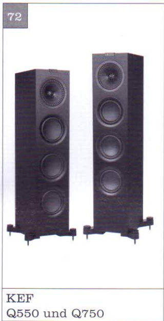
KEF Q550 und Q750