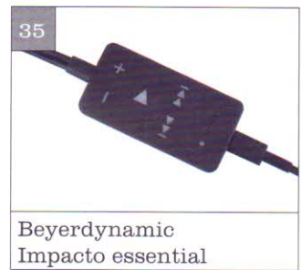
Beyerdynamic Impacto essential