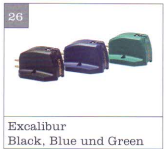
Excalibur Black, Blue und Green