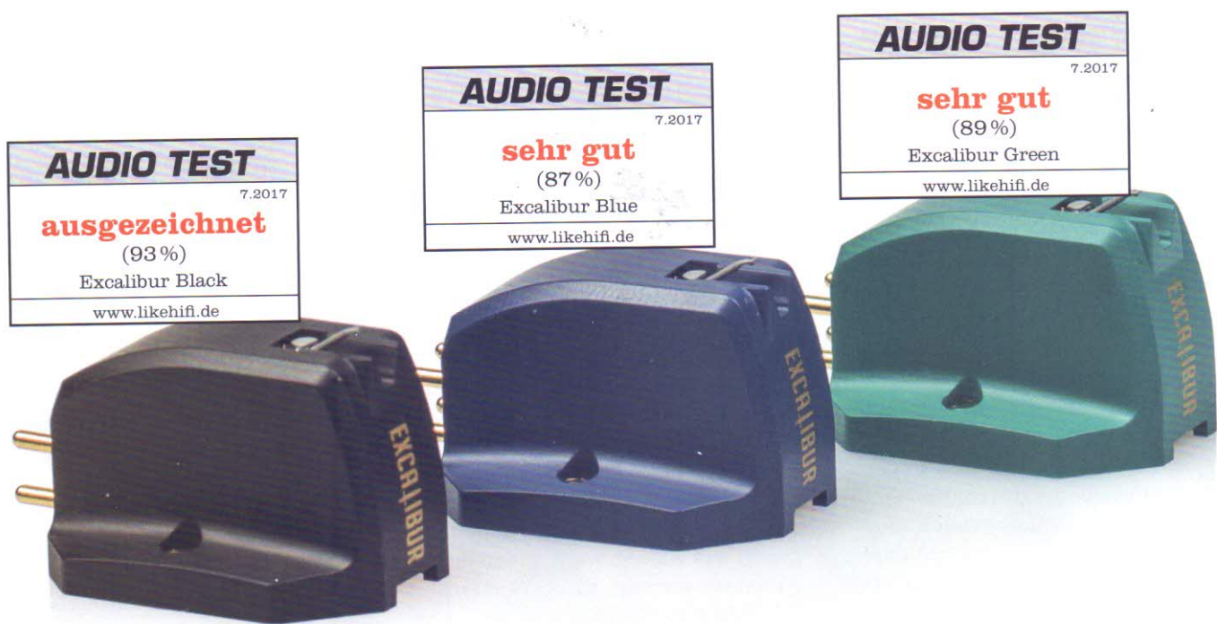
Excalibur Black, Blue und Green