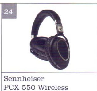
Sennheiser PCX 550 Wireless