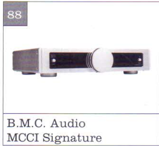
B.M.C. Audio MCCI Signature