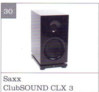
Saxx ClubSOUND CLX 3