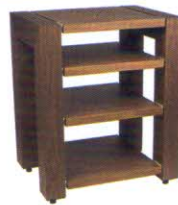
Roterring Amitara 14