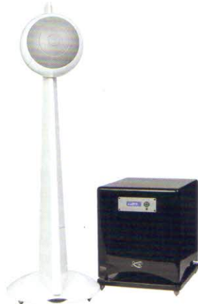
Cabasse Grand Baltic 4 & Santorin 30-500