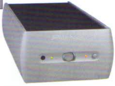
Audio Alchemy DMP-1