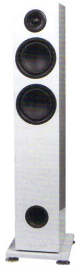
Triangle Elara LN05