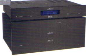
Audionet AMP I V2 & PRE I G3