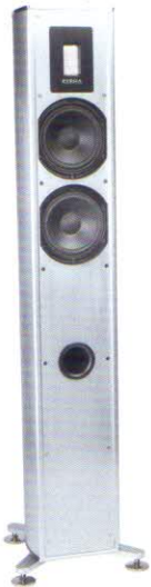
Piega Premium 701