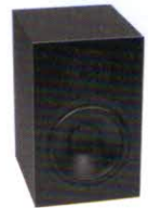
Nubert nuBox 383