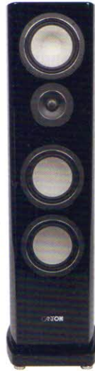
Canton Reference 7 K