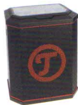
Teufel Rockster Air