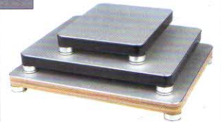
bFly-audio BaseTwo Pro