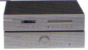
Musical Fidelity M3si & M3sCD