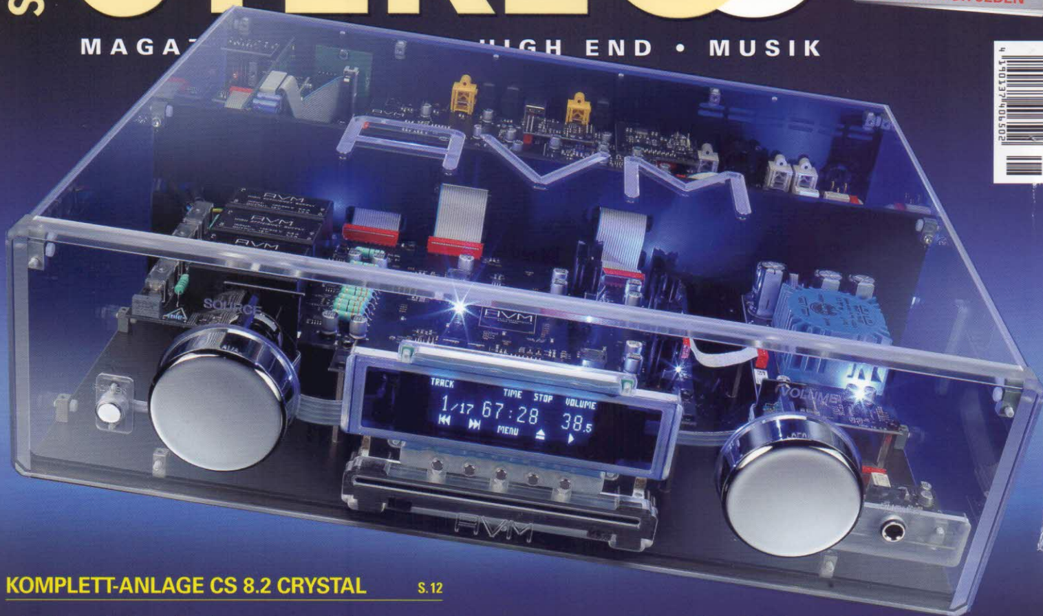
KOMPLETT-ANLAGE CS 8.2 CRYSTAL S.12